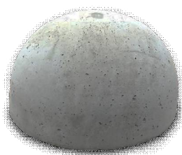
Бетонное основание полусфера