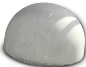
Бетонное основание полусфера