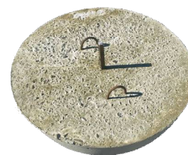
Полусфера с закладной для крепления к поверхности