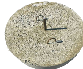
Полусфера с закладной для крепления к поверхности