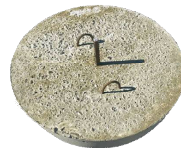
Полусфера с закладной для крепления к поверхности

* Цена указана с учетом доставки в г. Ростов-на-Дону или в любой город до 40-50 км от г.Шахты Организуем доставку, выгрузку, монтаж (кран манипулятор)!!!