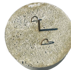
Полусфера с закладной для крепления к