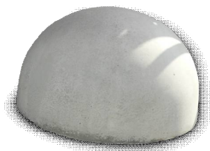
Бетонное основание полусфера