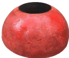
Полусфера-снование с закладной