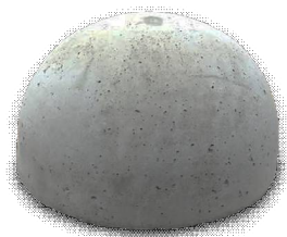
Бетонное основание полусфера