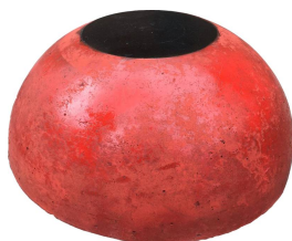
Полусфера-снование с закладной