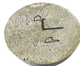
Полусфера с закладной для крепления к поверхности